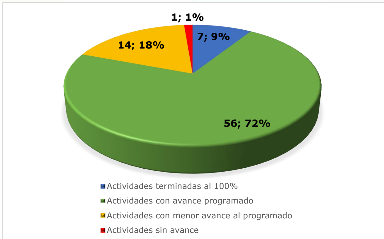
Gráfico 2: Fuente elaboración propia OAP- con base anexo 1. Matriz de Seguimiento Plan de Acción Institucional- Cuatrimestre II- corte 13 de septiembre de 2024.

A continuación, se detalla el número de actividades programadas en el PAI por dependencia y el avance registrado: